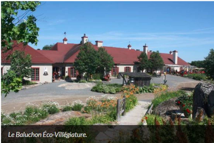
Le Baluchon Éco-Villégiature.