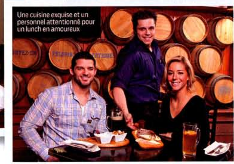
Une cuisine exquise et un personnel attentionné pour un lunch en amoureux