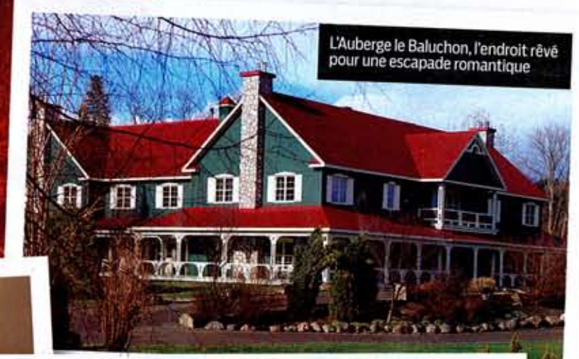
L'Auberge le Baluchon, l'endroit rêvé pour une escapade romantique

A.P.: J'avoue qu'au retour, à Whistler, je me suis ennuyée de lui, il me manquait. Mais nous nous sommes raisonnés. Nous étions conscients que nous participions à un jeu,