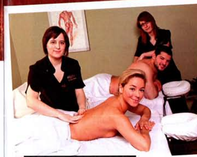
Des massages suédois à deux doublent le bonheur.