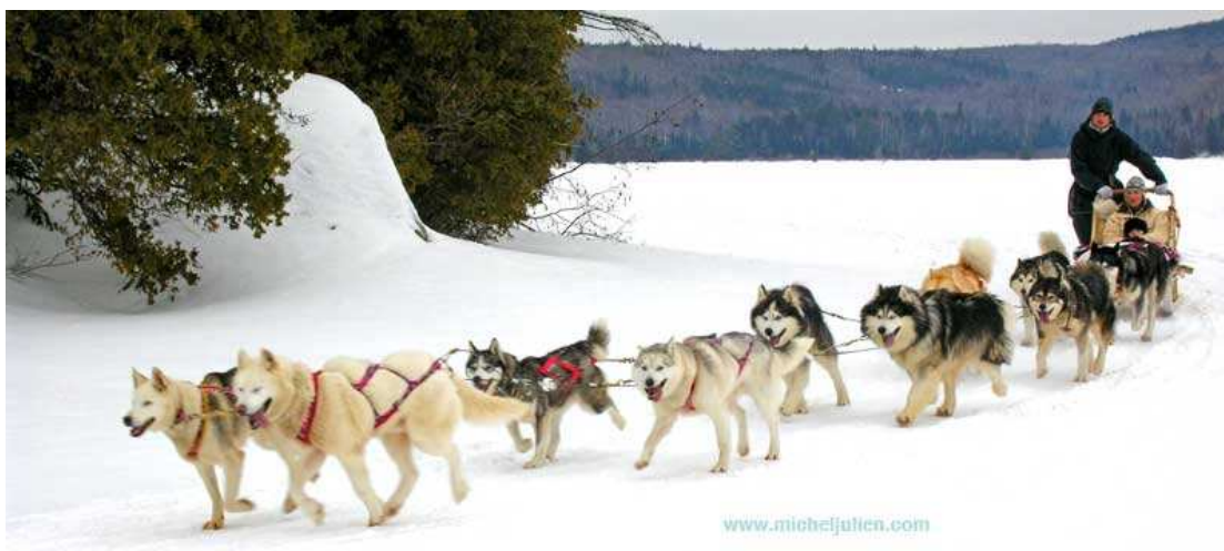
Traîneau à chiens sur le lac Sacacomie, Mauricie

Loin d'être aussi ennuyeux que l'on veut bien le croire! Laissez de côté vos préjugés et présentez-vous sur la glace intérieure du Château Montebello pour y faire l'expérience de cette activité vraiment amusante.