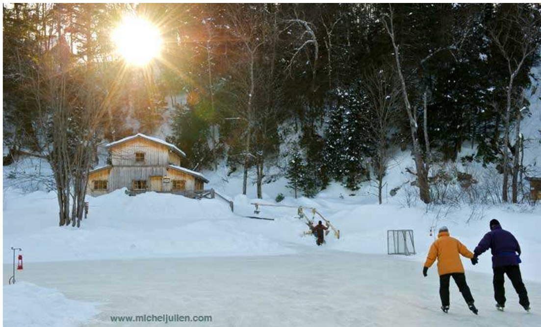
Patinoire sur la rivière du Loup à l'Auberge Le Baluchon