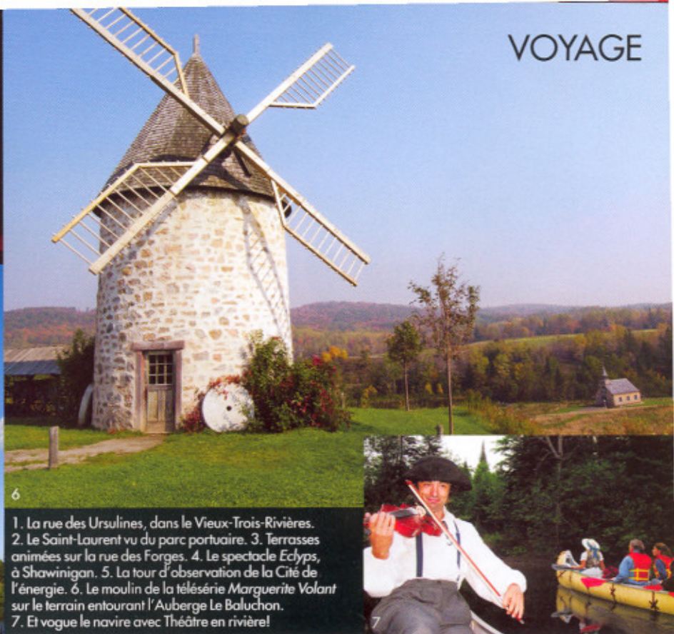
1. La rue des Ursulines, dans le Vieux-Trois-Rivières. 2. Le Saint-Laurent vu du parc portuaire. 3. Terrasses animées sur la rue des Forges. 4. Le spectacle Eclips , à Shawinigan. 5. La tour d'observation de la Cité de l'énergie. 6. Le moulin de la télésérie Marguerite Volant sur le terrain entourant l'Auberge Le Baluchon. 7. Et vogue le navire avec Théâtre en rivière!