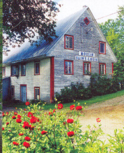
Un aperçu du site sur lequel est situé le Moulin Saint-Louis (à droite)